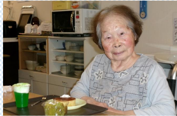
かき氷や習字のレクリエーションです。生き生きとされていますね。