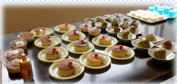
色々なメニューがあって美味しそう