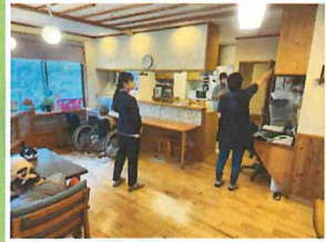
施設内は木目調でその地域に馴染んでいました。

ユニットリーダー研修実地研修施設間交流の一環として、ユニットケアにおいては20年以上の歴史のある愛知県西尾市の『特別養護老人ホーム せんねん村』を見学させていただきました。木造でゆったりと時間が流れる心地よい暮らしが印象的でした。当施設でも施設実習体制をより深化させるとともに、更なるケアの質向上に努めていきたいと思っております。