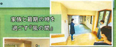
家族と最期の時を過ごす『風の間』