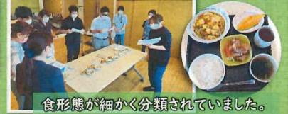
食形態が細かく分類されていました。