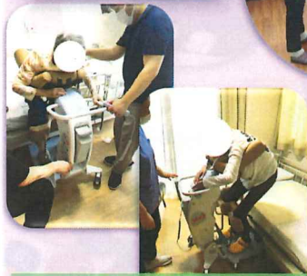
自立支援にも効果があり♪