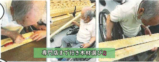
専門店まで行き木材選び♪