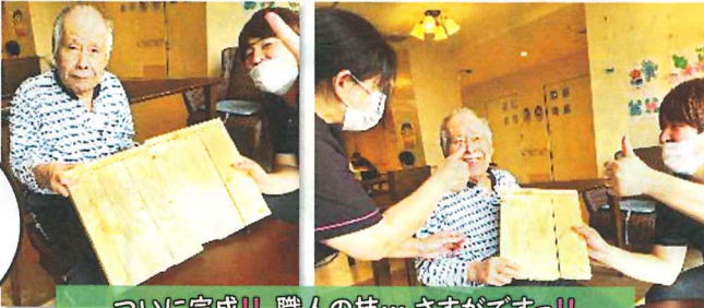
ついに完成!! 職人の技…さすがですっ!!

『こだわったところはどこですか?』と聞くと、『こだわりなんてないよ。』と謙虚な返答でしたが、作る目つきは真剣、手つきはまさに匠の技でした♪当施設はこれからも暮らしの継続とご入居者さまの意向や好みを叶えるケアに努めてまいります♪