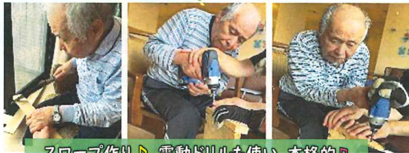
スロープ作り♪電動ドリルも使い、本格的♪