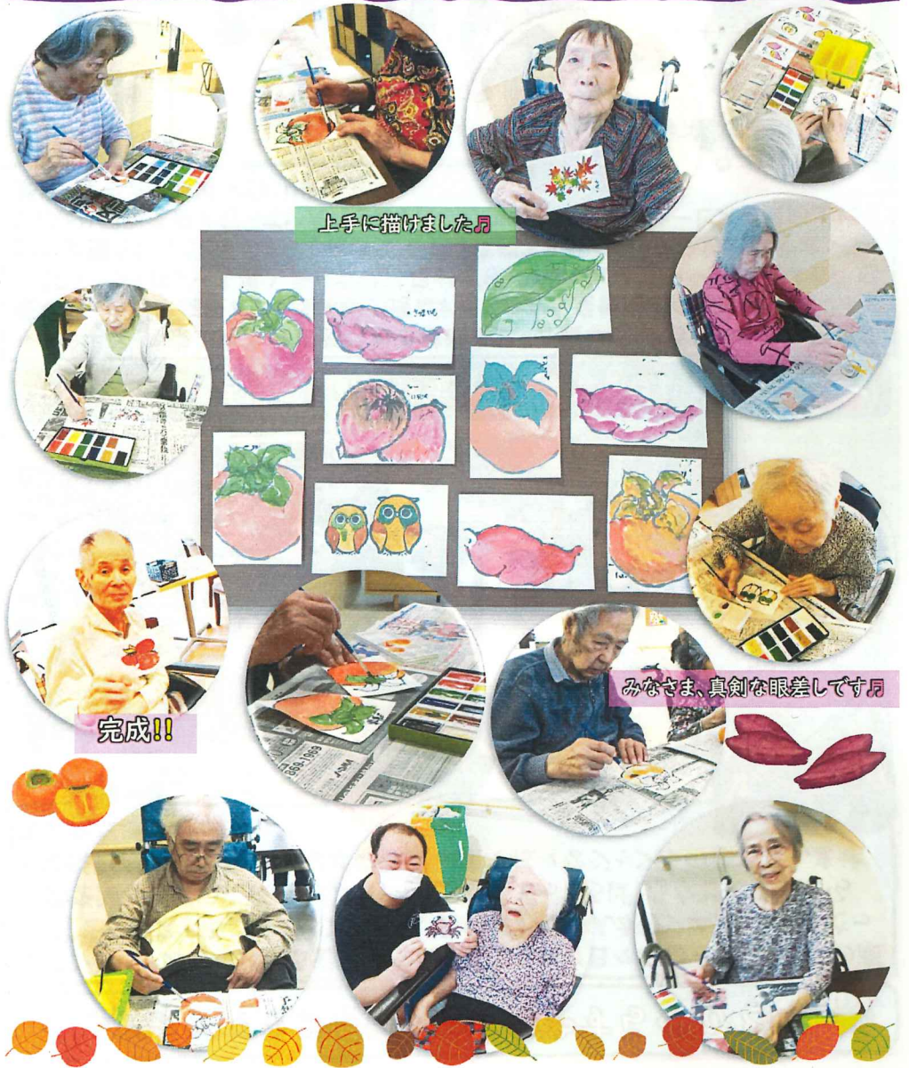
上手に描けました♪

『絵手紙教室』を新しいクラブ活動としてはじめました♪筆を持ち、好きな色を選び、描いていくと個性豊かな作品が完成しました♪みなさま、描くことに集中しておられました♪これからも暮らしを彩る活動を増やしていきます♪